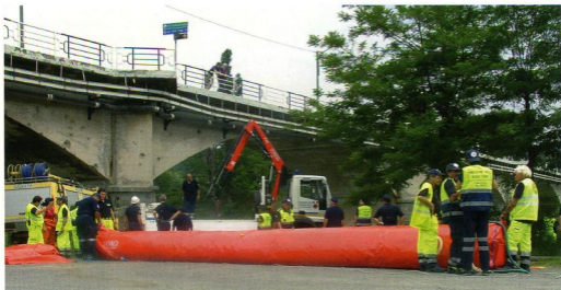
Un 'big banner' gonfiabile in dotazione alla Regione Piemonte per contrastare le esondazioni