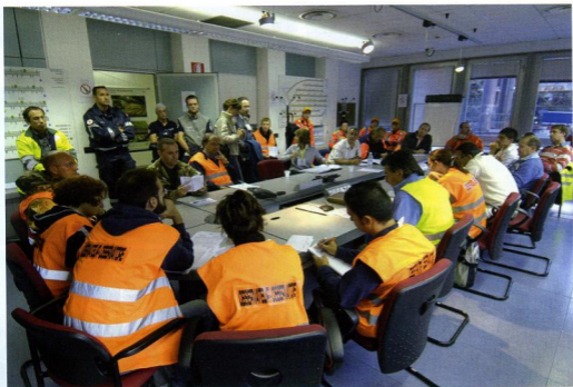
Briefing nella sede del Comitato regionale della CRI di Torino