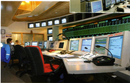
Sala operativa del tunnel del monte Bianco