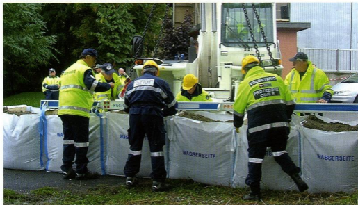
Nuova generazione di sacchetti antiesondazione in dotazione alla Regione Piemonte

comportamenti, che si attivano durante le fasi di un'emergenza. In particolare si è voluto adottare il 'metodo di anticipazione dei comportamenti' secondo il quale è possibile visualizzare una situazione, nei suoi aspetti positivi o anche critici, ponendo così intervenire, sebbene virtualmente, con dei correttivi acqui-