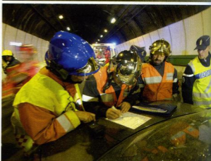
Simulazione di un incidente stradale nel tunnel del Monte Bianco